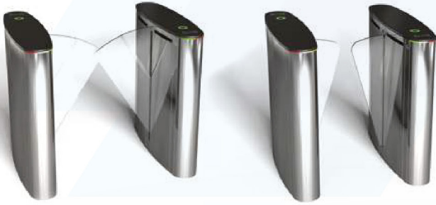
RT LTOP 111 H

מעברים מהירים מתאימים לכניסות מבוקרות כגון: מוסדי ממשלה, מוסדות אקדמאים, קנטרי, חדרי כושר ובמקומות המעוניינים בתנועה מבוקרת.