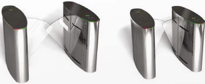
RT LTOP 101 H