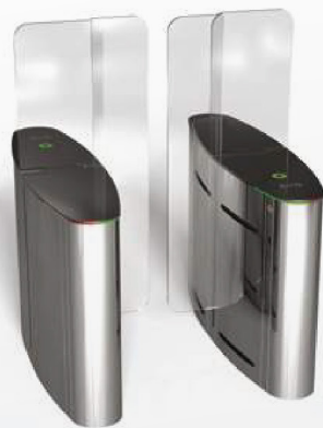
RT LTOP 301