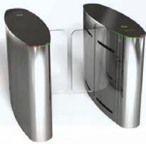
RT LTOP 201

מעברים מהירים מתאימים לכניסות מבוקרות כגון: מוסדי ממשלה, מוסדות אקדמאים, קנטרי, חדרי כושר ובמקומות המעוניינים בתנועה מבוקרת.